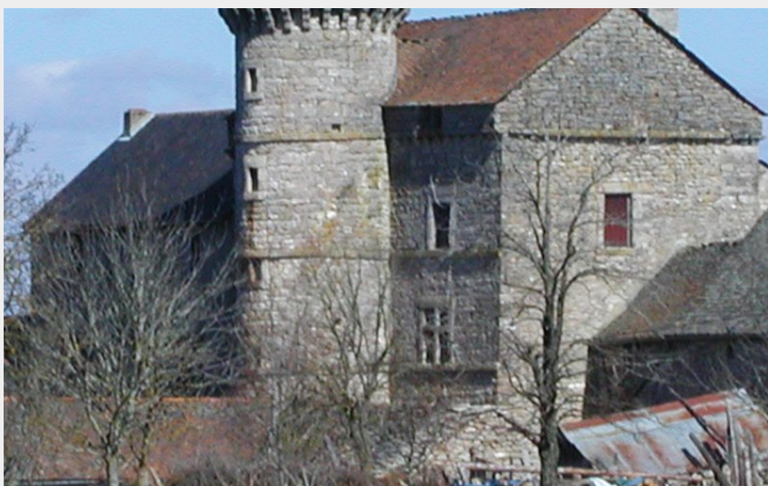
Ferme fortifiée du Choizal (OTI Mende)