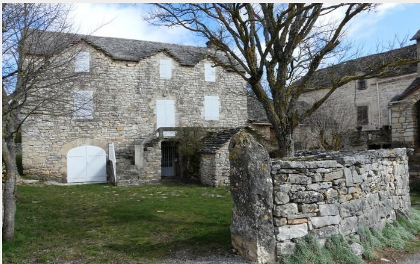
Le village d'Anilhac