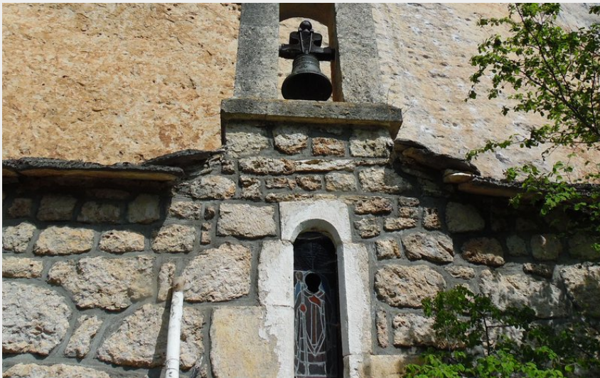
Chapelle St HILAIRE (OTAGDT)