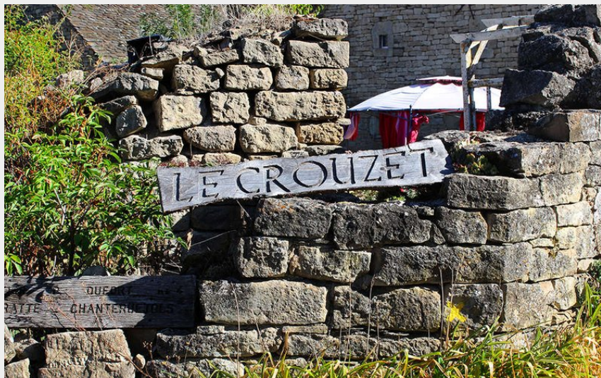
village du Crouzet