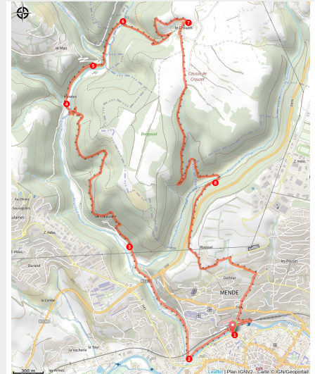
Hameau du Crouzet (Chastel-Nouvel - 48)

Ce circuit vous emmènera sous les ombrages de la forêt domaniale de Mende jusqu'au petit causse du Crouzet et au joli hameau qui porte son nom.