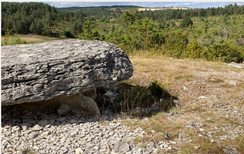
Dolmen sur le cause de Sauveterre