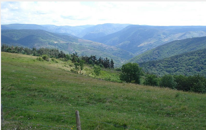
Col du Thort (Havang(nl))