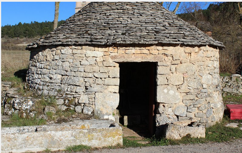
Puit dans le village du Falisson