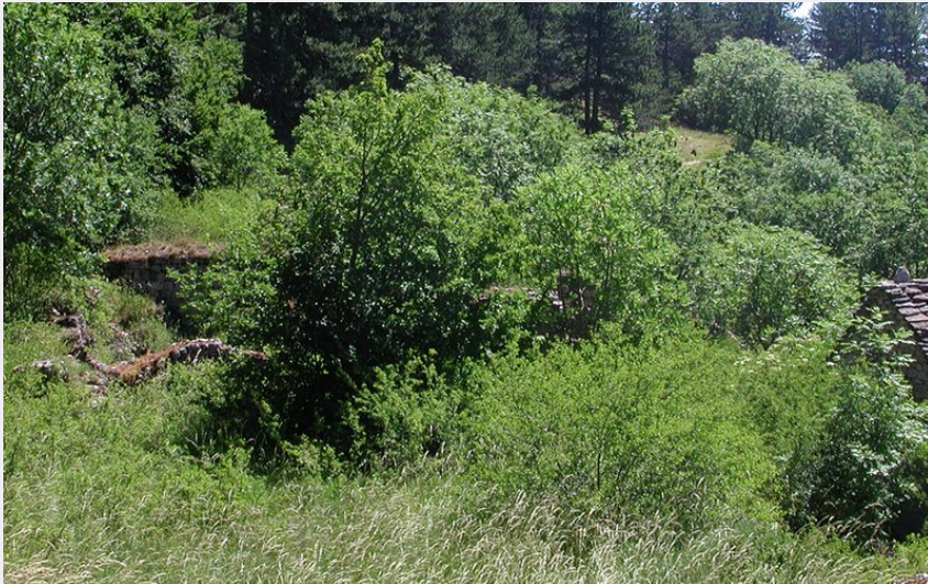
Hameau abandonné du Gerbal