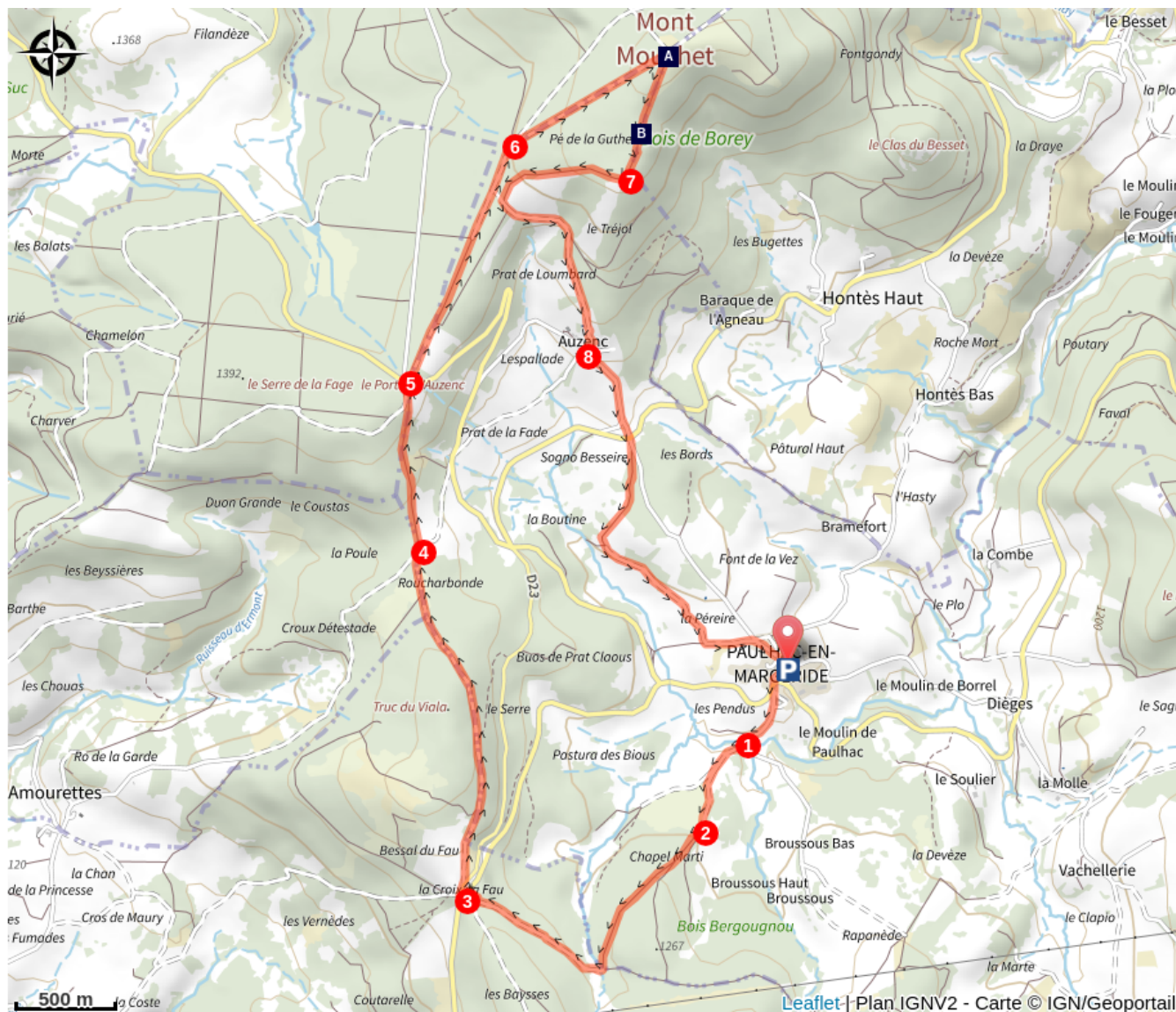
Le Mont Mouchet (A)