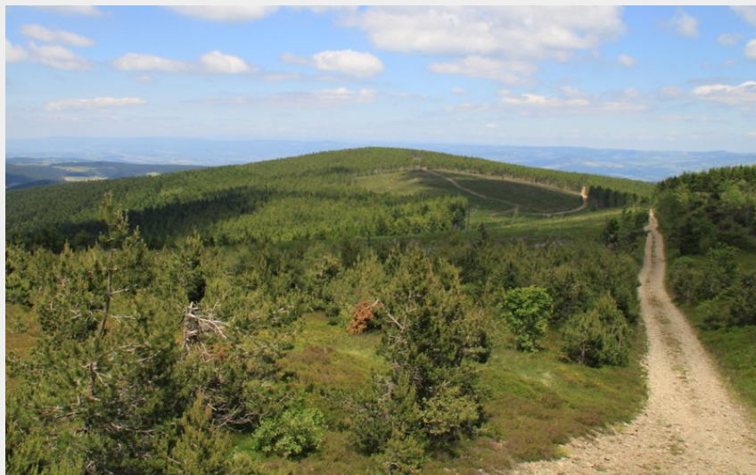
Le Mont Mouchet