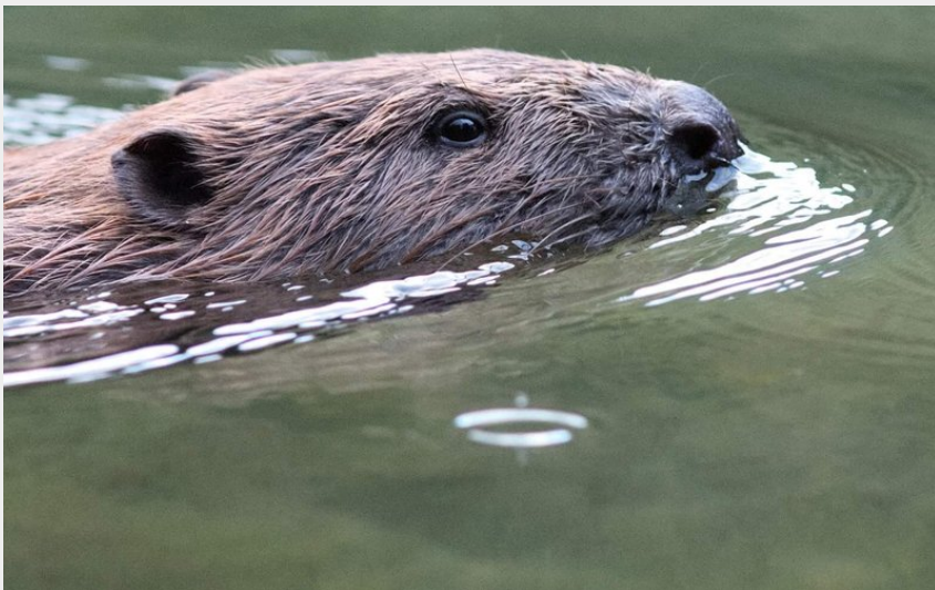
Loutre dans Tarn