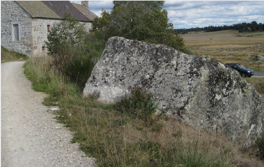
Les roches de granit à côté du Moulin de la Folle