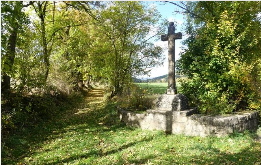
Croix autour de Chadenet