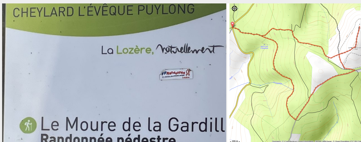
Panneau de départ de la randonnée (CCHA)

Deux sources importantes sont situées sur la montagne, à moins de 2 km l'une de l'autre : celles de l'Allier et du Chassezac qui n'alimentent pas le même bassin. En effet, l'Allier se jette dans la Loire (océan Atlantique) alors que le Chassezac descend vers l'Ardèche et le Rhône (mer Méditerranée).