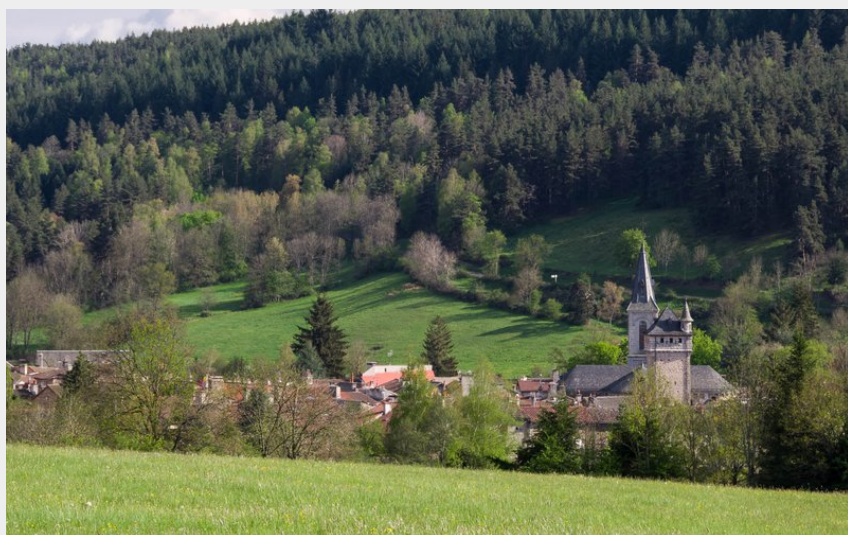
Autour du Malzieu