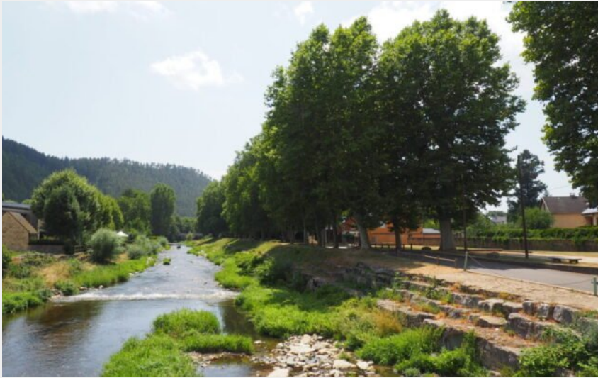
Les abords de la Colagne (Office de Tourisme Gévaudan Destination)