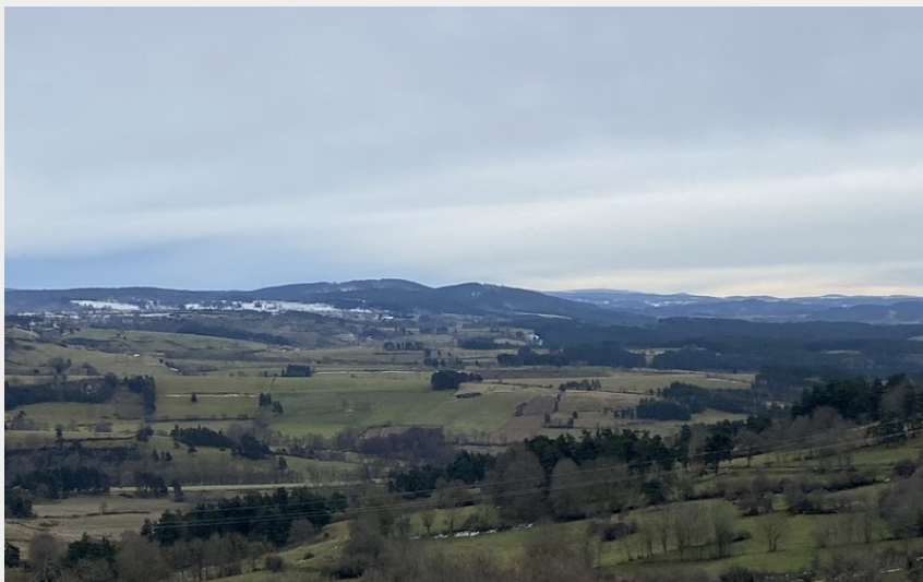
Vue sur les crêtes de la Margeride jusqu'au Truc de Fortunio