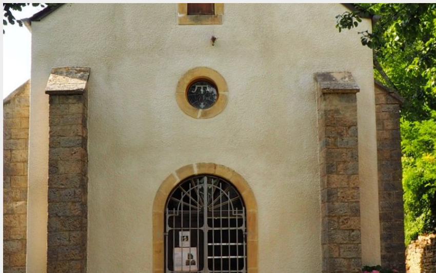
Chapelle Ste Thècle (OTCCGD)