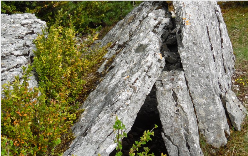
Dolmen près de Soulages (OTAGDT)