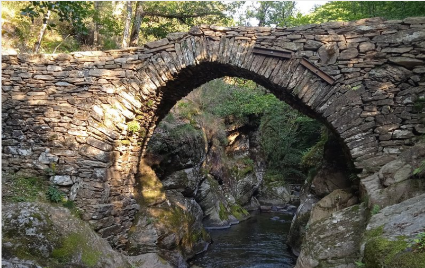
Pont de Mesclon