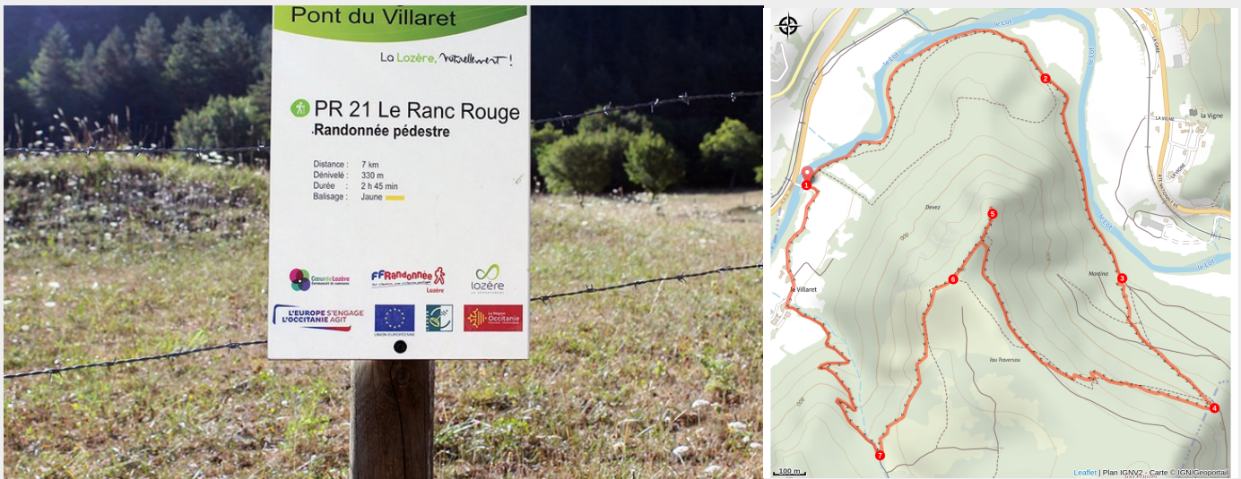
Panneau départ du sentier Ranc Rouge

Ce circuit, au départ du pont du Villaret, vous fera remonter le long du Lot sur sa rive gauche avant de grimper sur un éperon du Causse de Sauveterre dominé par le "Ranc rouge". Cette déformation du mot occitan "ronc" signifie "rocher" : ici, le calcaire est teinté de rougeâtre par des oxydes de fer. De ce point haut, la vue embrasse la vallée du Lot et la Margeride. En chemin, la fontaine de Saint-Véran évoque le premier emplacement du village de Barjac.