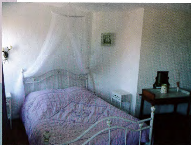
La " Romantique "