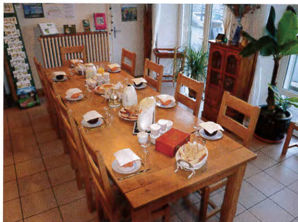
Table d'hôtes sur réservation. A votre disposition, terrasse, jardin, véranda avec vestiaire, revues, documentations et jeux de sociétés. Nous servons des boissons chaudes et fraîches au bar. Au salon vous disposez d'un PC, Wifi gratuit dans toute la maison, bibliothèque..... Picnics sur réservation.