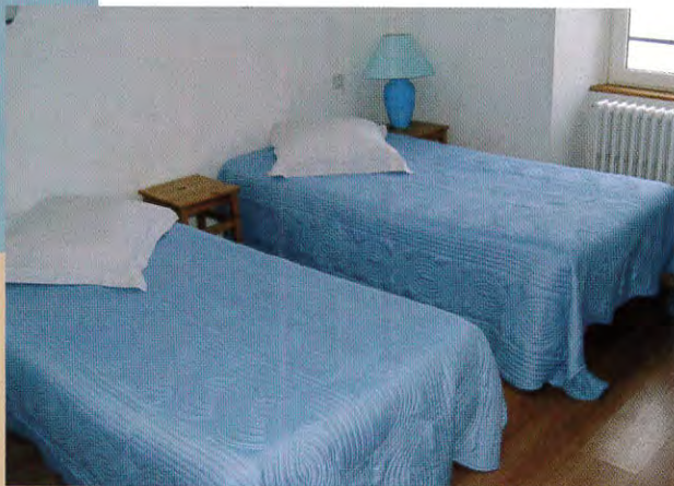
La " Familiale "

Vous recherchez confort et ambiance familiale, notre demeure dispose de 5 chambres aux thèmes différents et équipées de salle de bain ou de salle d'eau avec sanitaires privés.