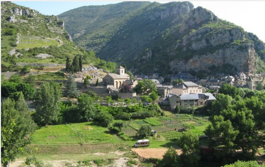
Vue sur La Malène