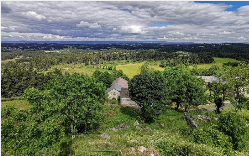
Point de vue rocher du cher (OT Aubrac Lozérien)