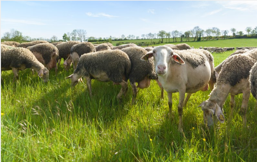
Brebis dans un champ sur le causse de sauveterre