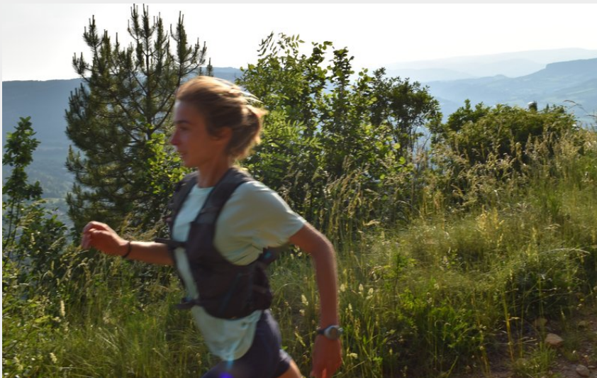
Coureur au dessus de la vallée du Lot