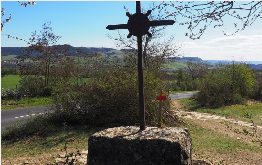
Sur le sentier des chazelles (OTCCGD)