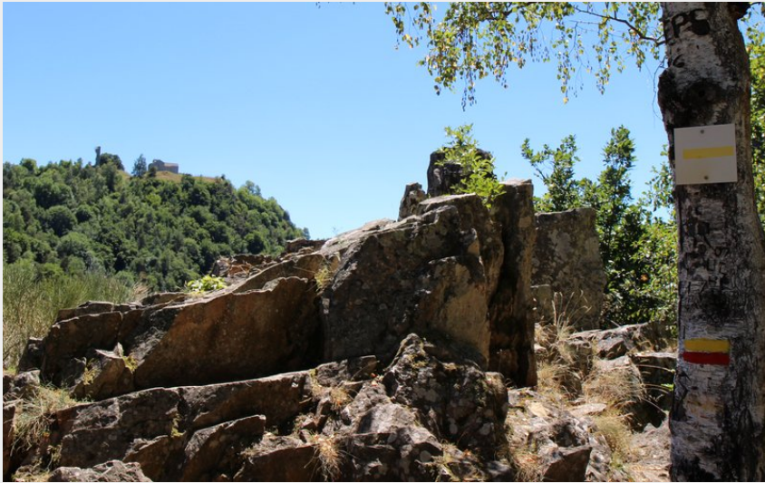
Sentier des espagnols balisage