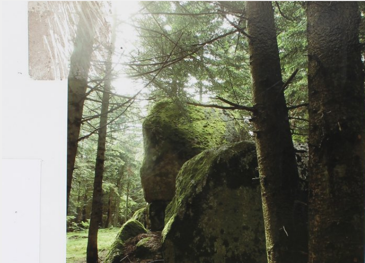
Découverte en chemin