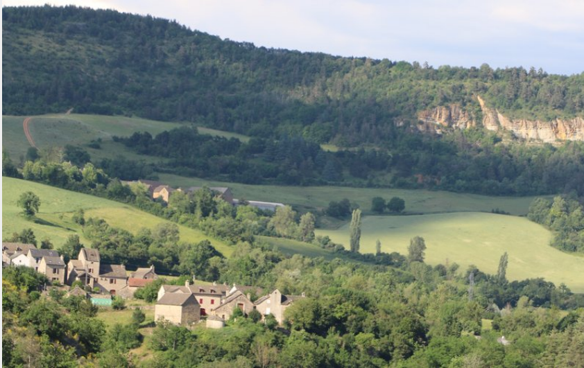
Chabannes et la ferme de Malavielle vus du Villard Sentier des saliens (OTAGT)