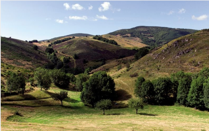
Les paysages de l'Aigoual (Olivier Prohin)