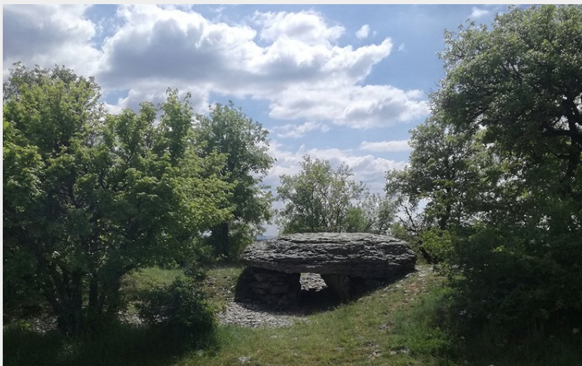
Dolmen de la tuile sur le Causse de Changefège