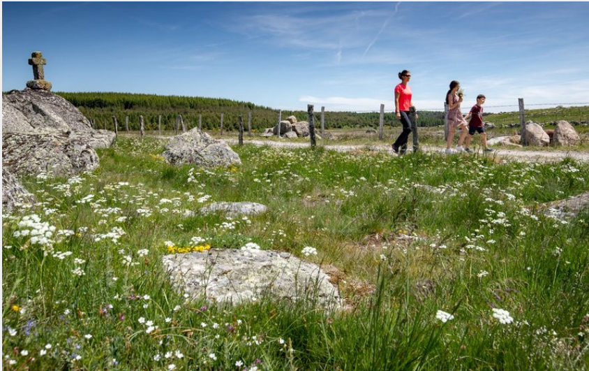
Un chemin de randonnée borné de fleurs