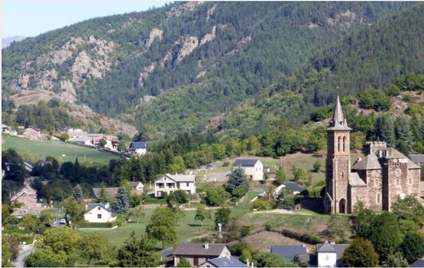
Vue sur Bédouès