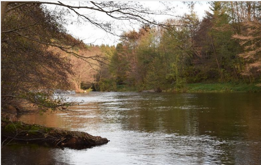
Le Tarn à Bédouès