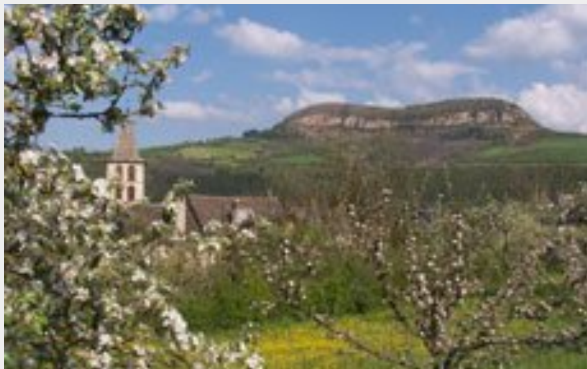
Le Truc de St bonnet