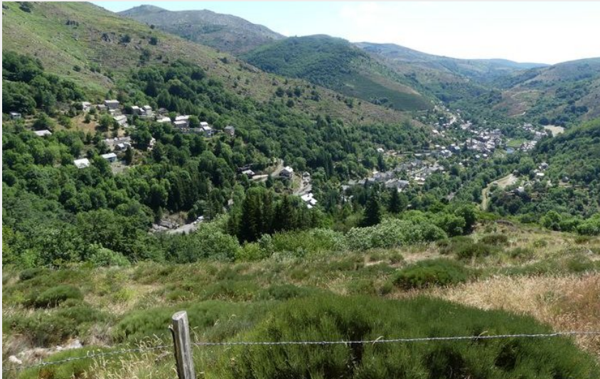
Vue sur le Pont de Montvert (Nathalie Thomas)