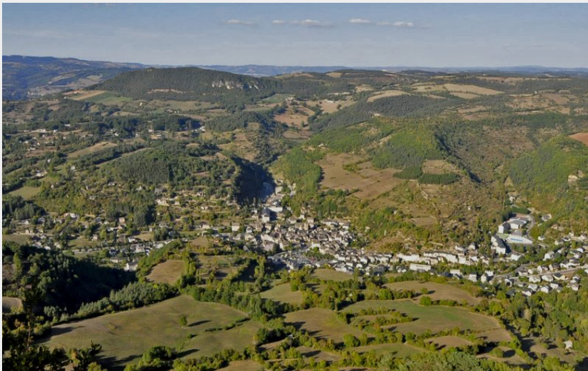
Vue du Rocher de Roqueprins