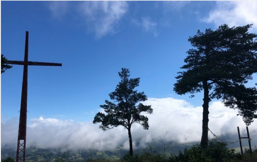
La croix de Roqueprins