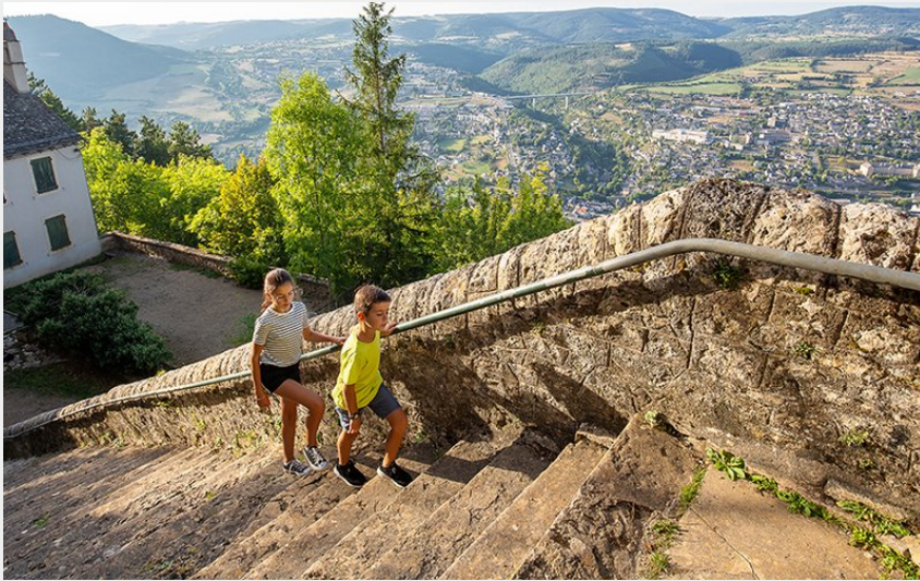
L'Ermitage Saint-Privat à Mende (48) (B. Colomb)