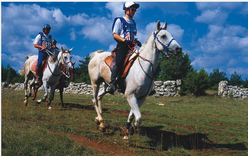
Course d'endurance équestre