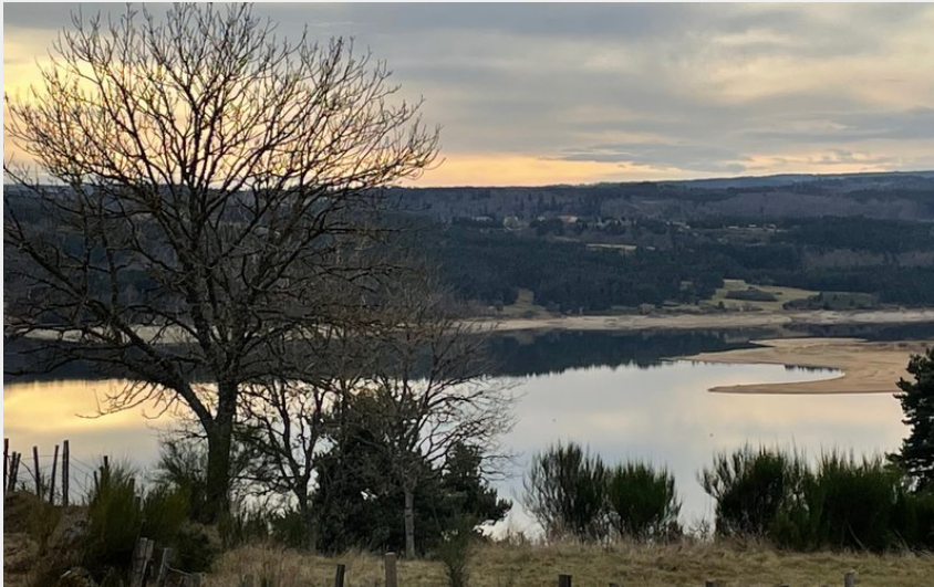
Vue sur le lac depuis l'itinéraire de randonnée