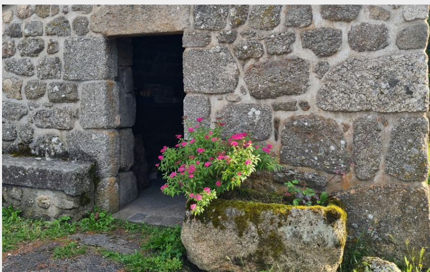
Le petit patrimoine sur le chemin, le four à pain