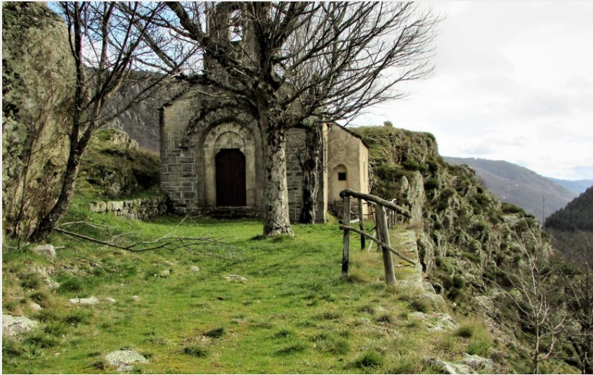
Chapelle des Baumes