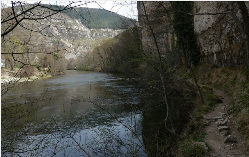
Le Tarn