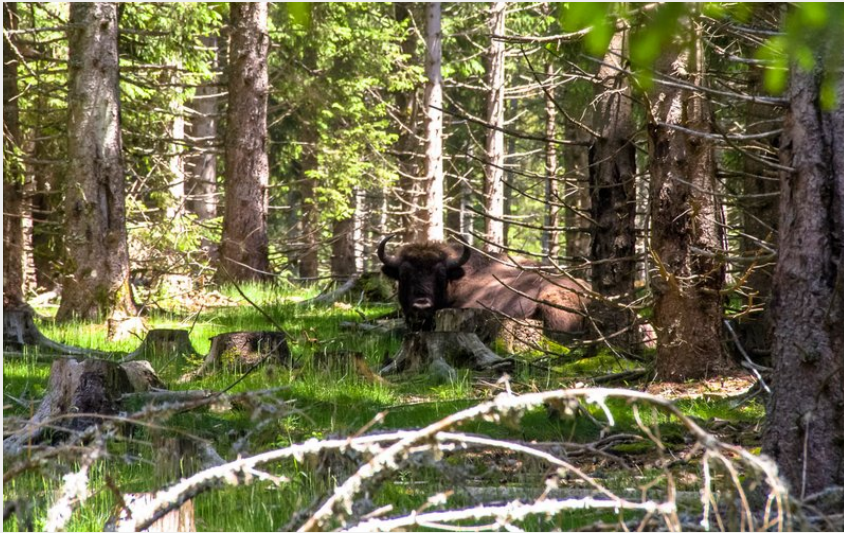
Bison du parc des bisons d'Europe