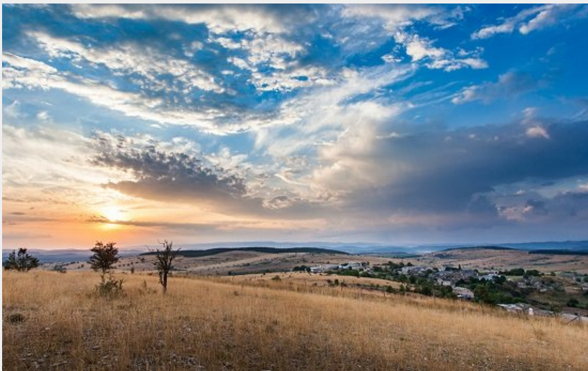
Causse de Sauveterre