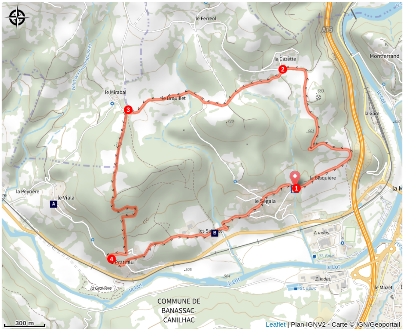
Eglise Saint-Antoine (A)