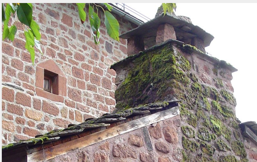
Cheminée en grès rouge