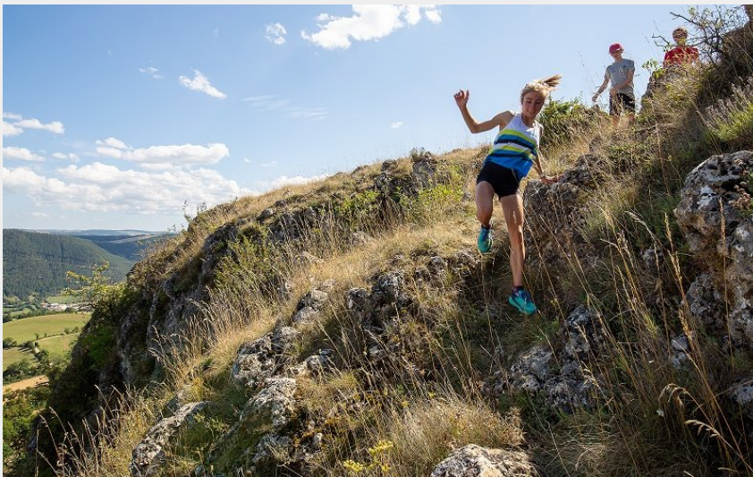
Un peu de technique en descente