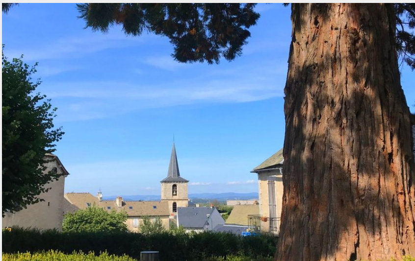
L'église d'Aumont Aubrac